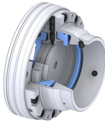
SPANNTOP mini Gr. 65