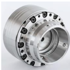
SPANNTOP nova SPANNTOP mini