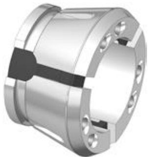
Spannkopf RD Gr. 65