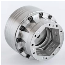
TOPlus TOPlus mini